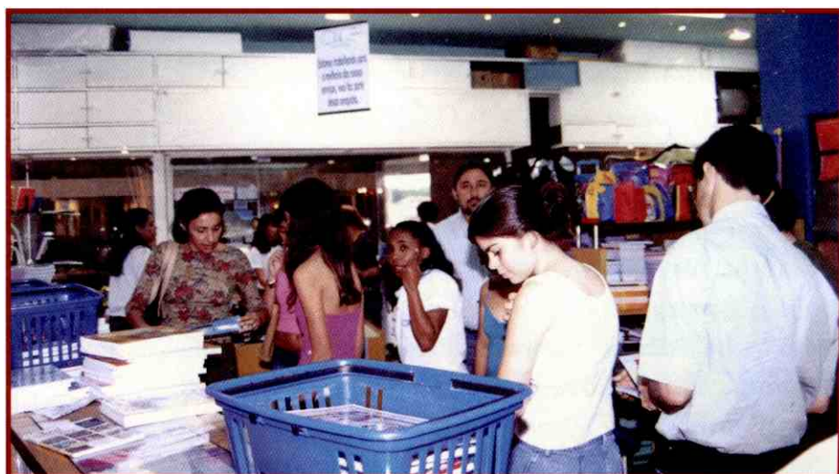
Movimento nas papelarias aumentou nas últimas semanas