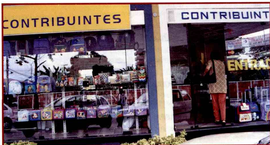
Clientes estão comprando com mais tranquilidade

para a volta as aulas este ano é que, como o país apresenta uma maior estabilidade econômica, os consumidores parecem comprar com mais tranquilidade, programando os pagamentos com maior nível de segurança. O prazo, na verdade, é uma arena fundamental para garantir a venda, já que no início do